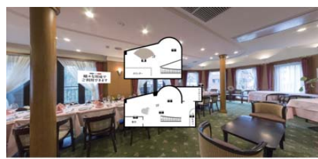
<フレンチレストラン>